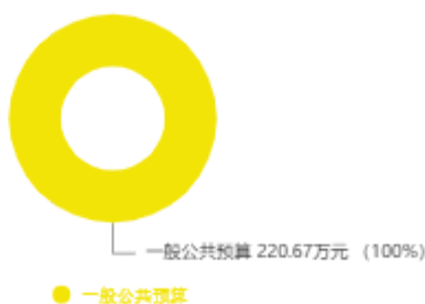
本年收入预算结构图

新乡市应急救援保障中心2025年收入合计220.67万元，其中：一般公共预算220.67万元；政府性基金预算0万元；国有资本经营预算0万元；财政专户管理资金收入0万元；事业收入0万元；事业单位经营收入0万元；上级补助收入0万元；附属单位上缴收入0万元；其他收入0万元；上年结转结余0万元。